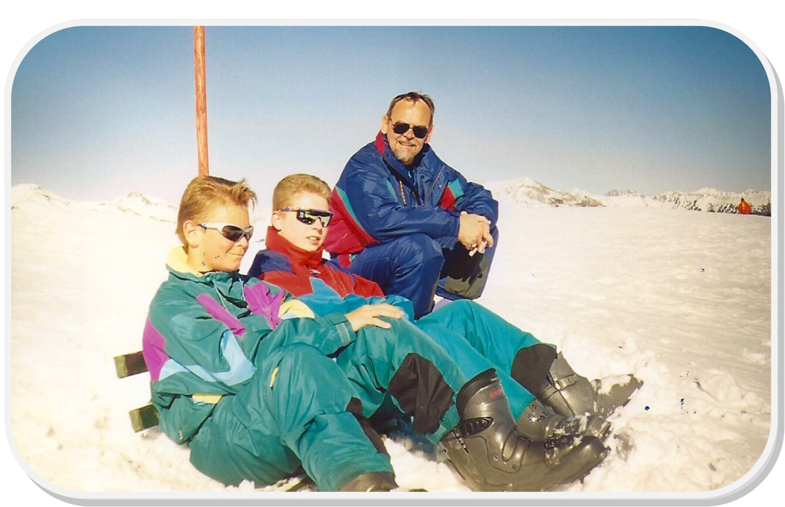
På toppen af Plattenkogel i strålende solskinsvejr Bænken er delvist begravet i sne.